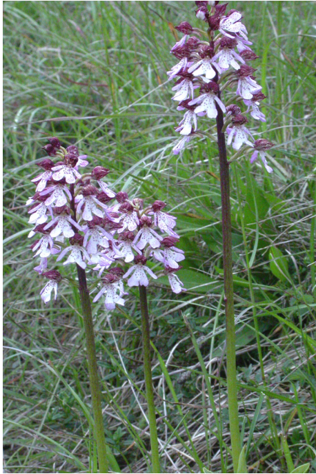
Purpur-Knabenkraut ( Orchis purpurea )

Die offenen Bereiche sind von Gebüschern aus Liguster ( Ligustrum vulgare ), Berberitze ( Berberis vulgaris ), Wolligem Schneeball ( Viburnum lantana ) und anderen Sträuchern gesäumt. Pionierholzart auf den Freiflächen ist die Zitterpappel ( Populus tremula ).