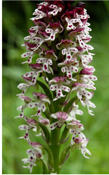
Brand-Knabenkraut ( Orchis ustulata )