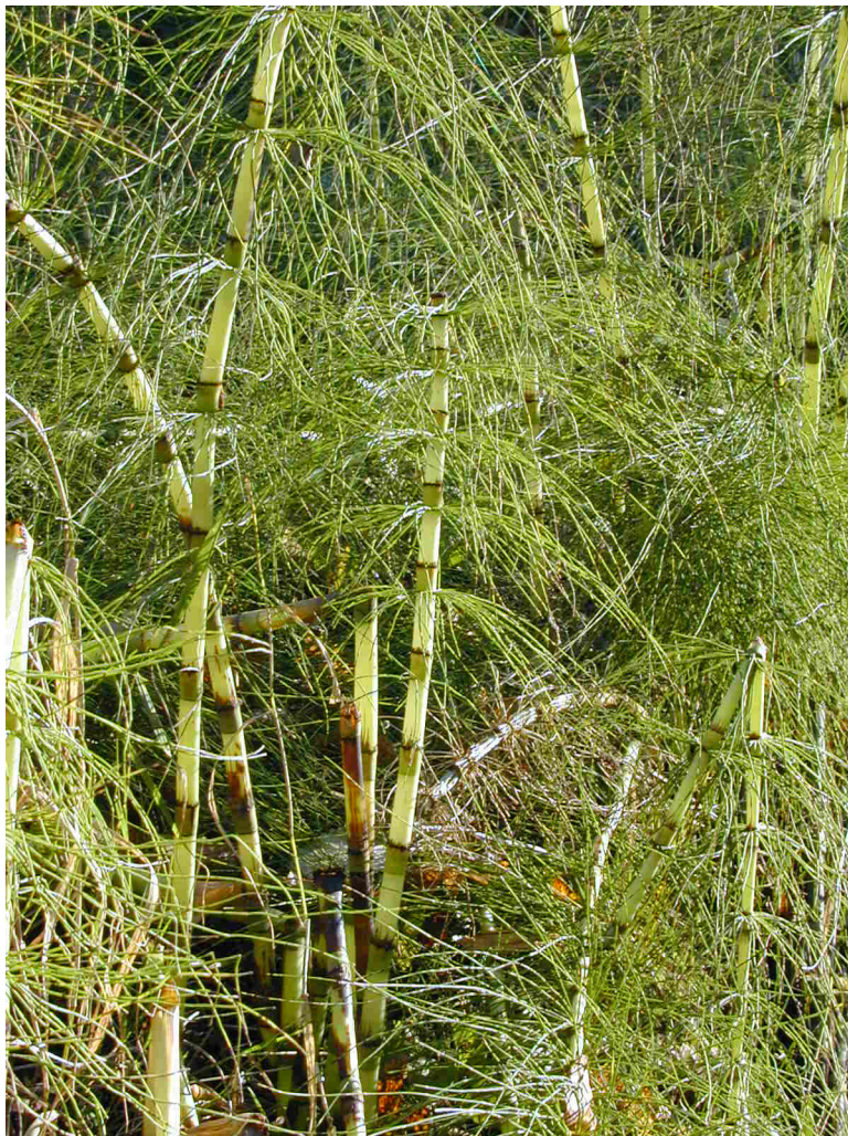
Equisetum maximum im Sommer

sporentragende Blätter), an deren Unterseite weiße Beutel gebildet werden (die Sporangien), welche mit Sporen gefüllt sind. Diese Sporangien platzen bei der reife und entlassen tausende von Sporen. Die Sporen entwickeln sich unterirdisch zu kleinen bleichen, geschlitzten Lappen weiter, auf denen die Sexualorgane gebildet werden. Nachdem schwimmende Spermatozoide darauf die Eizelle befruchtet haben, wird erst die eigentliche Schachtelhalm-pflanze gebildet. Das Ganze nennt man einen Generationswechsel. Der kleine unterirdische Lappen stellt die geschlechtliche Generation dar. Ihre Zellen besitzen nur einen Chromoso-