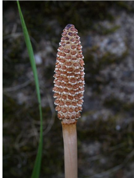
Riesenschachtelhalm, junger Trieb mit Sporophyll im April

Schachtelhalme gehören zu den Sporenpflanzen. Ähnlich wie der kleinere Ackerschachtelhalm entstehen im Frühjahr zunächst bleiche, chlorophyllose Triebe, an deren Spitzen Sporophyllstände stehen. Diese bestehen aus kleinen sechseckigen tischförmigen Schuppen (die Sporophylle, also