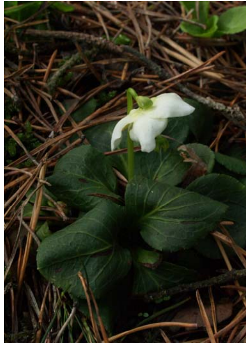
Einblütiges Wintergrün ( Moneses uniflora )