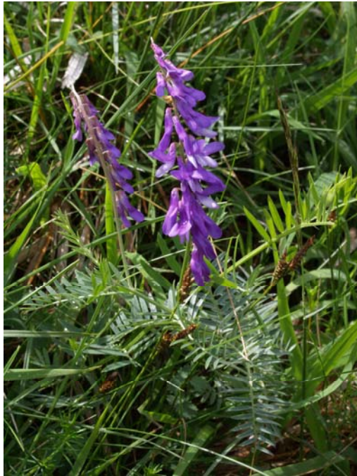
Feinblättrige Wicke ( Vicia tenuifolia )

vulgaris ), Hufeisenklee ( Hippocrepis comosa ), Berg-Klee ( Trifolium montanum ), Zittergras ( Briza media ), Färber-Ginster ( Genista tinctoria ), Wiesenknopf ( Sanguisorba minor ), Primeln ( Primula veris ), Mittlerem Wegerich ( Plantago media ), Flügelginster ( Chamaespartium sagittale ), und Knolligem Hahnenfuß ( Ranunculus bulbosus ). Den Wiesen-Bocksbart ( Tragopogon pratensis ) sollte man nicht allzu spät suchen – er blüht nur vormittags.