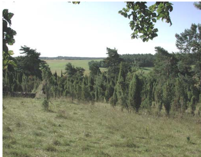
Der Reinersberg bei Dollendorf

Das Gebiet war schon recht stark wiederbewaldet und ist daher auf der topografischen Karte oben noch als Wald dargestellt. In jüngerer Zeit wurde der Wald aber bis auf einige Kiefern und andere