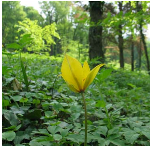
Wild-Tulpe ( Tulipa sylvestris )